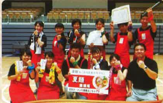
ちゃーしゅーや武蔵アピタ長岡店と長岡駅店で 11月13日～12月17日販売予定です。